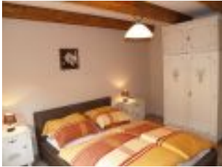
Schlafzimmer vom Ferienhaus Casa Romanita Haus 2