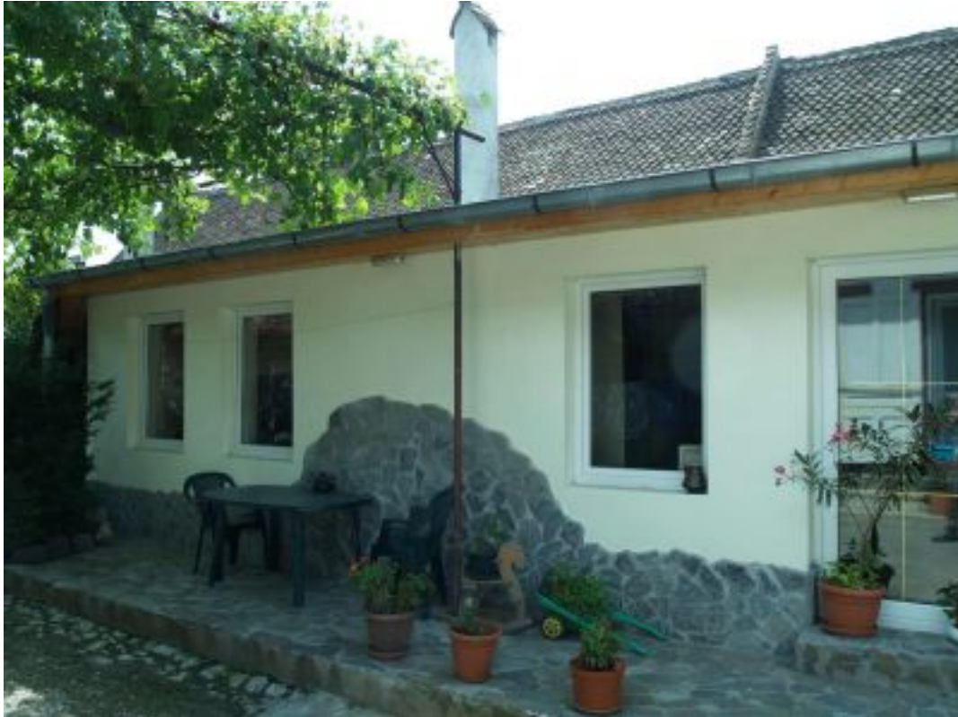
Außenansicht Ferienhaus Casa Romanita Haus 1 Außenansicht vom Ferienhaus Casa Romanita Haus 1

Dienstag, den 17. Januar 2012 um 13:42 Uhr - Aktualisiert Montag, den 05. März 2012 um 11:40 Uhr