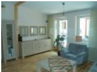
Wohnzimmer vom Ferienhaus Casa Romanita Haus 1.