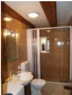
Bad vom Ferienhaus Casa Romanita Haus 2

Transylvaniens, in der Stadt Brasov. Casa Romanita bietet zwei Ferienhäuser an. Das größere Haus ist rund 110 m 2 und bietet Platz für 5 Personen. Das Haus 2 ist mit 80 m 2 etwas kleiner und bietet Platz für 4 Personen.