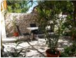
Terrasse vom Ferienhaus Casa Romanita Haus 2