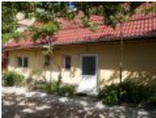
Außenansicht vom Ferienhaus Casa Romanita Haus 2