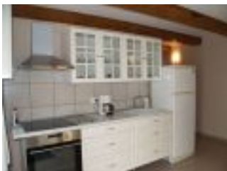
Küche vom Ferienhaus Casa Romanita Haus 2

pro Nacht und ist abhängig von der Saison sowie der Wahl des Hauses.