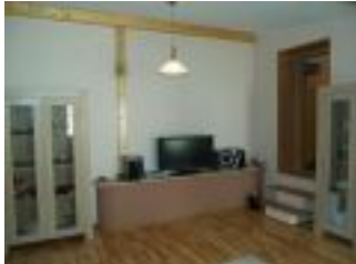
Wohnzimmer Ferienhaus Casa Romanita Haus 1