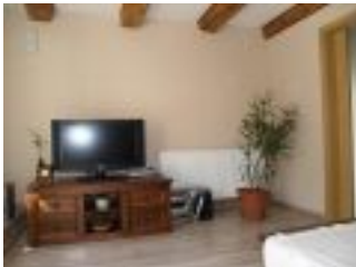
Wohnzimmer vom Ferienhaus Casa Romanita Haus 2.